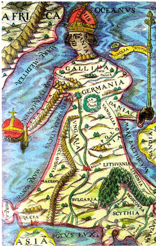
„Europa – Regina“ Abbildung aus S. Münsters Cosmographia von 1588